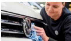
Volkswagen supera Toyota e diventa il 1° costruttore del mondo