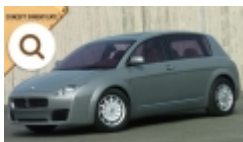
Maserati Buran, l'ammiraglia per l'America