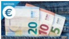
Bollo auto, quanto e come si paga