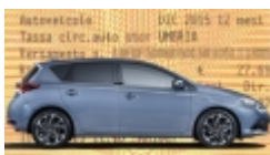
Auto ibride, tutte le agevolazioni regione per regione