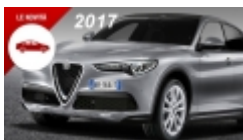
Novità auto del 2017, sarà un anno molto ricco