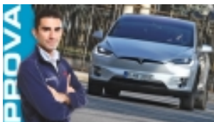
Tesla Model X, la prova del super-crossover elettrico [VIDEO]