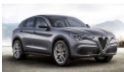
Alfa Romeo Stelvio First Edition, si può già ordinare a 57.300 euro